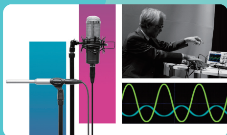
音波入門 - 音波の不思議を探る - 北野 正雄 京都大学教育担当理事・副学長